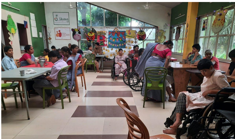
Alle 20 bewoners in the diningroom

Ook zijn er vanuit Bal Anand twee nieuwe bewoners op Umang gekomen waarmee het aantal op 20 komt.