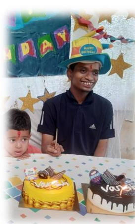
13 juni Vansh